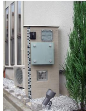
お客様と打ち合わせを重ね決定したデザイン門柱です。