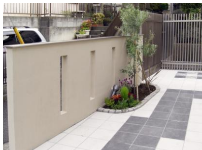
エントランス脇にオリーブを植えました エントランスは来客用駐車場も兼ねています