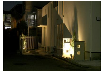
夜間のライトアップは電球色で柔らかさを醸し出しています。